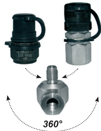
Nivelellä varustettu kulmaliitin