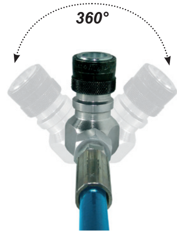
Nivel kääntyy 360°